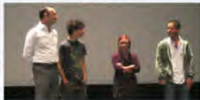
Presentación de Lake Tahoe en Guadalajara

Si les gustan las tramas sencillas Lake Tahoe es de vista obligatoria y la recomiendo ampliamente. Si Temporada de Patos te aburrió, pues aprovecha el verano y ve cuan cantidad de películas con efectos especiales y "harta acción" haya en cartelera... aunque ahí podrías no descubrir el significado de la vida.